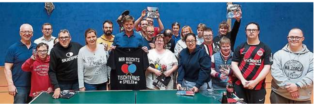
Die Teilnehmenden des Frühjahrs-Tischtennisturniers beim Facettenwerk in Hohenstein-Breithardt posieren für ein Gruppenbild.