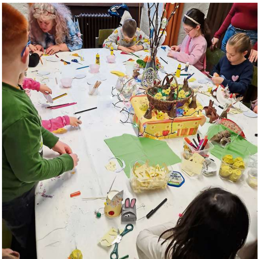
Etwa 100 Kinder nahmen am österlichen Kinderbasteln am Kirchort St. Ferrutius in Bleidenstadt teil.

am Brunnen angebracht, wofür dieser bestiegen und der Schmuck sorgfältig befestigt werden musste. Der geschmückte Brunnen soll die Innenstadt für etwa drei Wochen prägen. Bereits kurz nach der Fertigstellung hielten Passanten inne, um den Brunnen